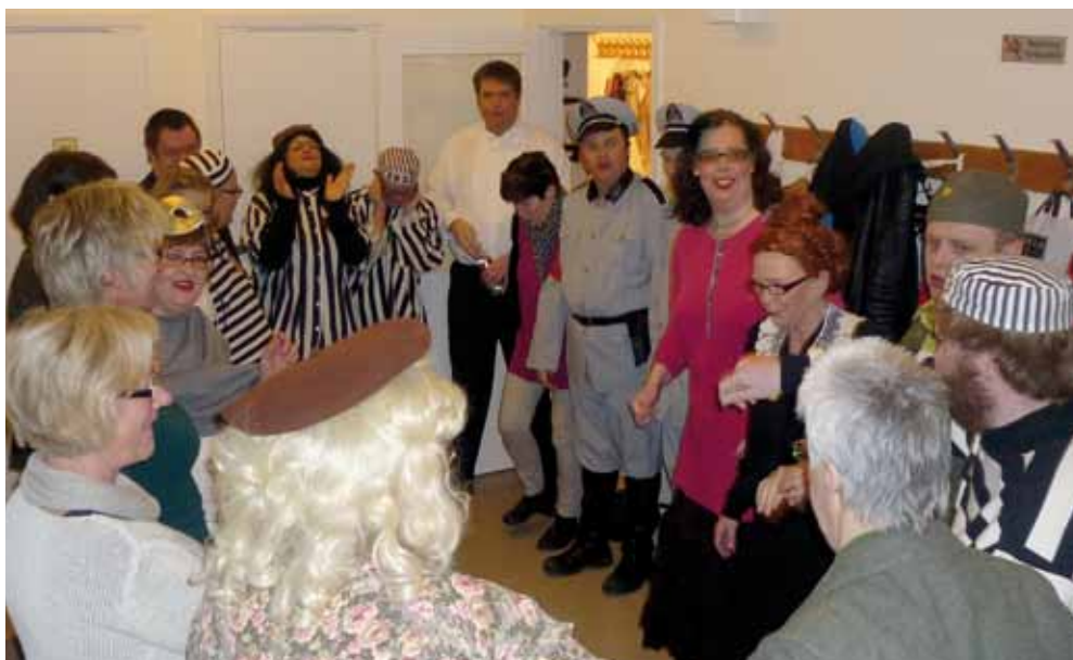
Guldkornen laddar för föreställning!