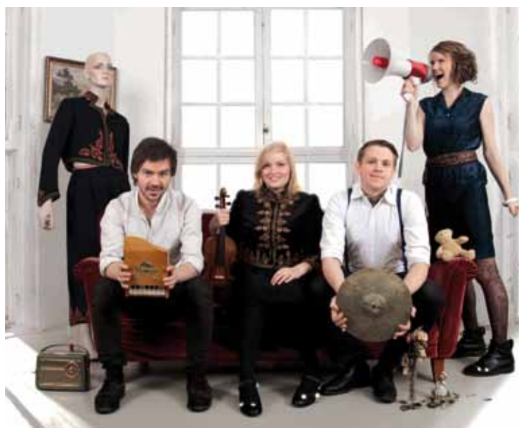
Navarra från Göteborg spelar på Sjöviks kör- och folkmusikfestival.