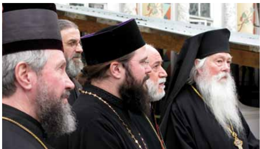
Resan var också en studieresa och biskoparna och deras följe guidades i den ryska kyrkohistorien. Här i Sergiev Possad kloster, den Stora Lavran, några mil utanför Moskva.