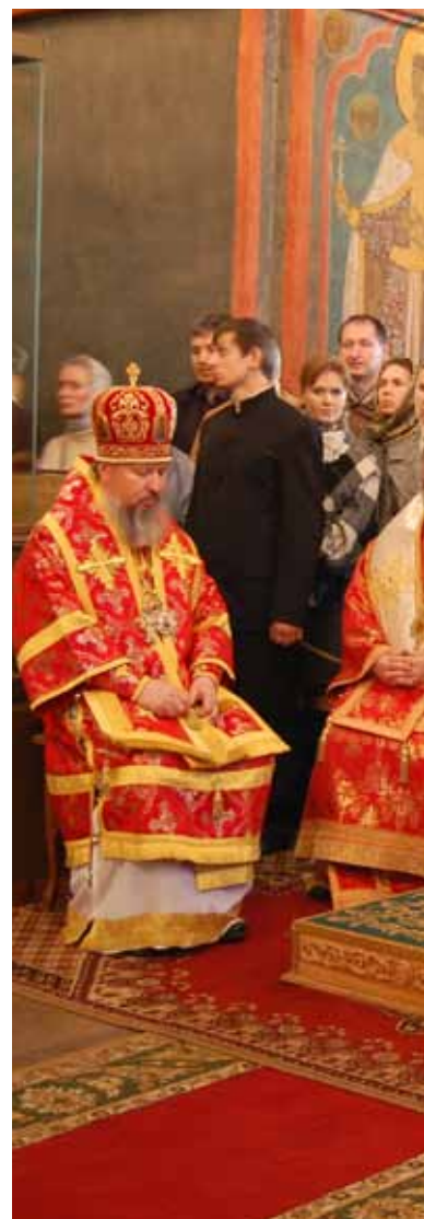
Mötet med patriarken i samband med firandet av 100-årsjubileet för den ryska kyrkans återupprättelse. Dositej från Serbisk-ortodoxa kyrkan och biskop Vladimir Aleksandrov med patriark Kirill.