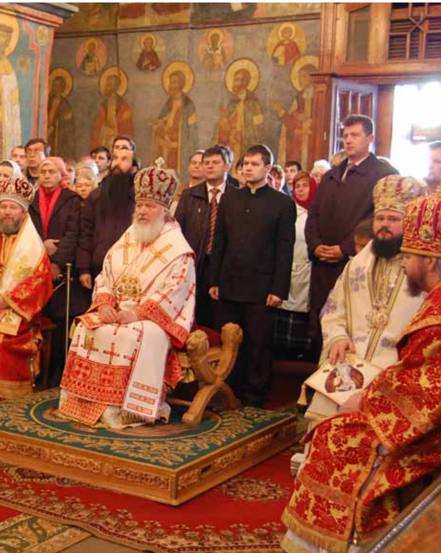
Det firandet av den gudomliga liturgin i Ärkeänglarnas kyrka i Kreml var resans höjdpunkt. Biskop Macarie från Rumänska-ortodoxa kyrkan, till vänster respektive höger, celebrerade tillsam-