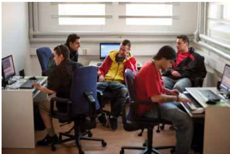
Beatsstudio är ett av rummen på HipHopcentralen där musiken byggs upp.