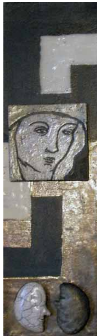
Några av verken från Samtal pågår :

Till Uppsala kom utställningen närmast från Visby domkyrka. I höst vandrar den vidare till Skara domkyrka, och sedan till Svenska kyrkan i London och Svenska kyrkan i Paris. Utställningen genomförs med stöd från Växjö Domkyrka, Visby Domkyrka och Studieförbundet Bilda. ■