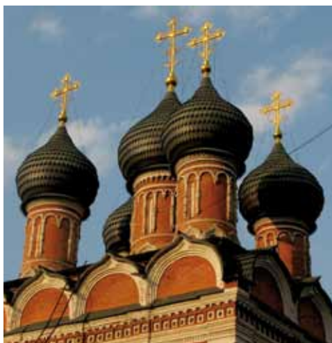
Gruppen besökte kloster och kyrkor i och utanför Moskva. Här kupolerna på en av kyrkorna i Petrovskaklostret.