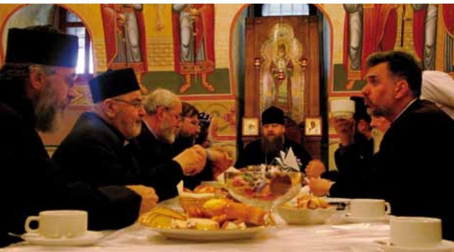
Delegationen mötte också andra företrädare för Moskvapatriarkatet, bland annat metropolit Merkurij, som förestår patriarkatets utbildningsdepartement. Under mötet togs initiativ till ett fortsatt utbyte mellan Sverige och Moskva.

Mötet med patriarken och hans medarbetare – och resan i övrigt – har stor betydelse för den fortsatta utvecklingen av samarbetet i Sverige. Resan arrangerades av Studieförbundet Bilda. Läs mer i kommande nummer i vårt nyhetsbrev Vax och guld och på bilda.nu/ortodox . ■