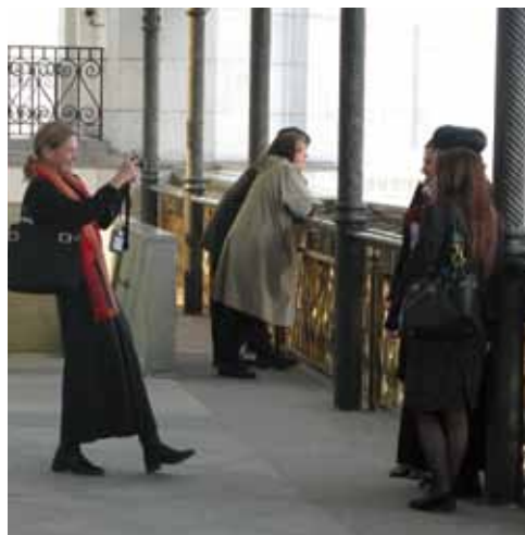
Från taket av Kristi frälsare katedralen har man en god överblick över Moskva.