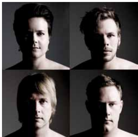
Rockbandet Adore från Jönköping ingår i Bilda Live Tour 2011